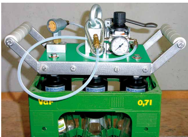
6er Handpackkopf für 0,7 l VdF-Flaschen