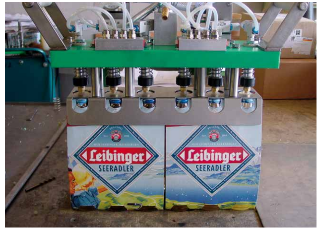
Spezial-Handpackkopf zum Umpacken von 2 Sixpack-Verpackungen in Pinolenkisten