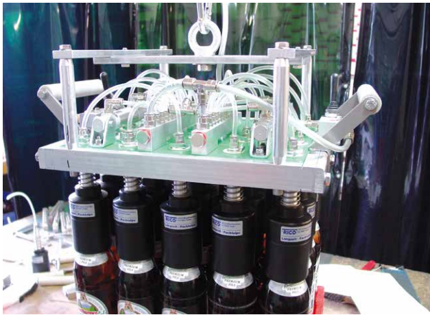
20er Handpackkopf für 0,5 l Euro-Flaschen

Mussten Sie bisher kleine Flaschenmengen oder ganz spezielle Flaschensorten aufwändig per Hand in Kisten packen? Oder ist ganz einfach das Geld nicht da, um in teure Maschinen zu investieren? Hier bietet RICO mit seinen Handpackköpfen eine günstige Lösung, um das Einpacken trotzdem zu automatisieren.